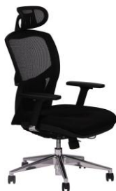
Gewicht 22,5 kg