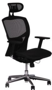
Gewicht 22,5 kg

Fünffuß-Untergestell, Aluminium-Druckguss poliert Mechanikgehäuse, Aluminium-Druckguss, Rückenabdeckung Aluminium hochglanz poliert Synchronmechanik in 3 Positionen arretierbar mit Körpergewichtseinstellung Sitz- und Rückenlehne ergonomisch geformt Sitzhöhe verstellbar zwischen 460 - 560 mm, Sitztiefenverstellung 50 mm Kopfstütze mit Netz, höhenverstellbar und neigbar 3-D-Multifunktionsarmlehnen mit weicher Armauflage, schwenkbar nach innen und außen höhenverstellbar, verschiebbar Armlehenträgerkern alu-polieret Rückenlehne höhenverstellbar mit Membrangewebe und Lordosenstütze separat höhenverstellbar Rollen für weiche Böden