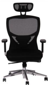
Gewicht 22 kg